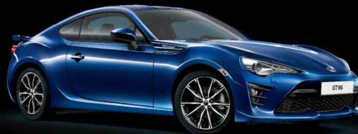
K3X Lapis Blue*