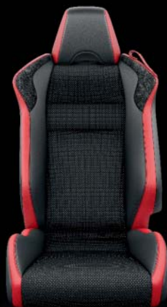
Alcantara®, noir et rouge, surpiqûres rouges En option sur Sport