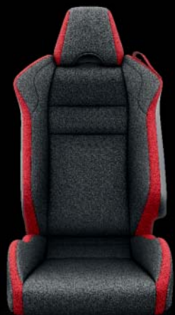
Tissu, noir et rouge, surpiqûres rouges En option sur Sport