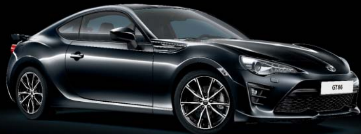
61K Dark Grey*