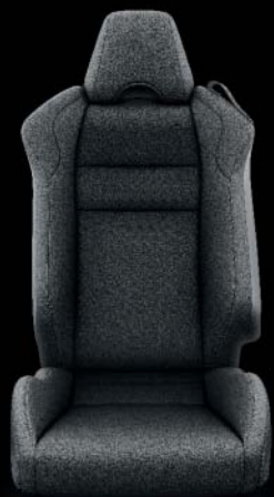
Tissu, noir, surpiqûres argentées* De série sur Race et Sport