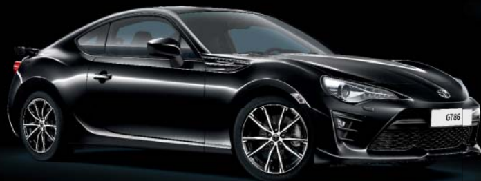
D4S Crystal Black*