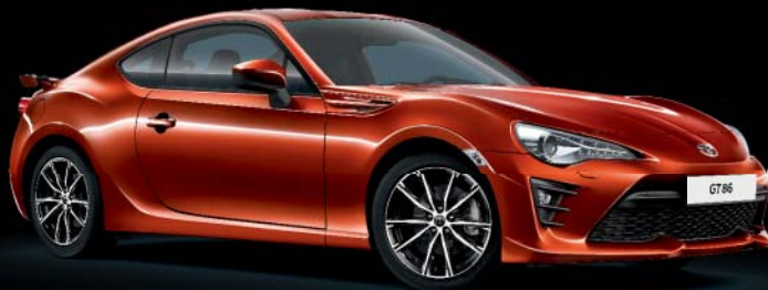
H8R Fusion Orange*