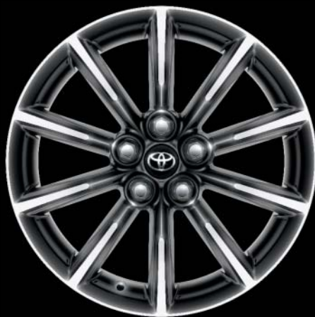
Jantes en alliage léger 16" (10 rayons) De série sur Race