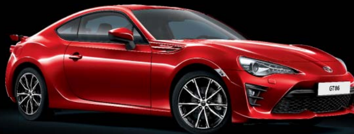
M7Y Pure Red