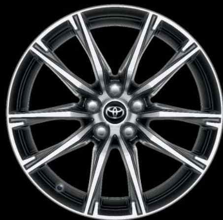
Jantes en alliage léger 17" (10 rayons) De série sur Sport